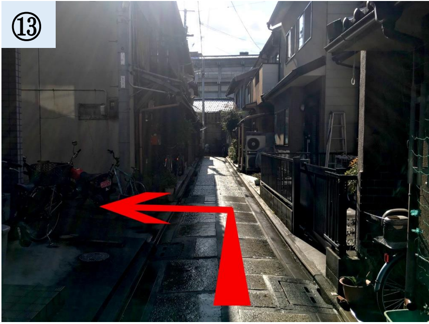
左に曲がって下さい