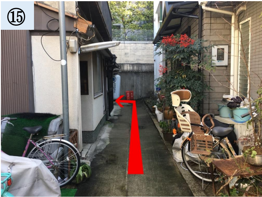
直進して、左に曲がって下さい